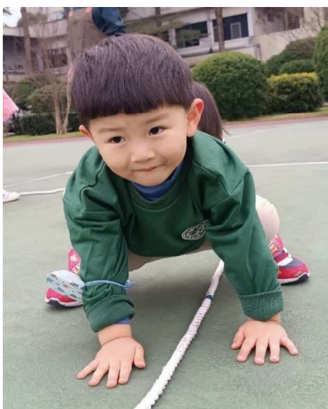
體能活動：感統訓練~~爬行