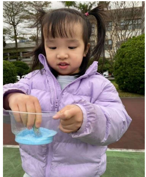
粉筆彩繪：混色遊戲