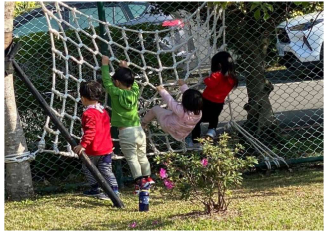
大肌肉活動:體能訓練~~攀繩索