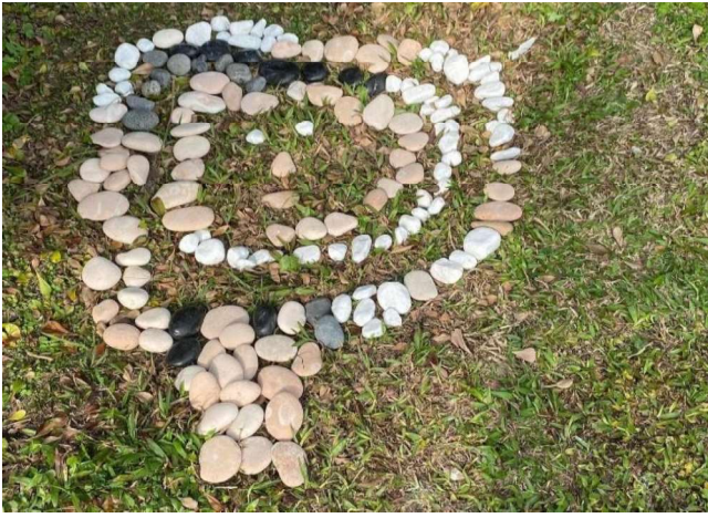
鬆散素材:專注力精細動作~石頭創作