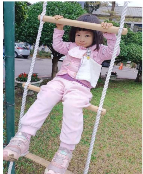
體適能：勇氣、自信養成