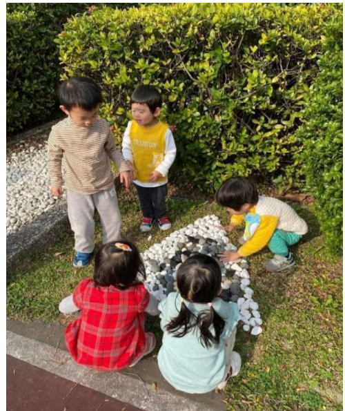
鬆散素材：石頭探索與合作學習~美感