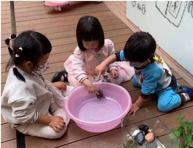
生命教育:愛護動植物與照顧~~飼養烏龜