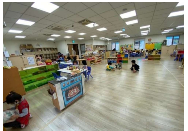
有機學習環境:學習區介紹~六大領域