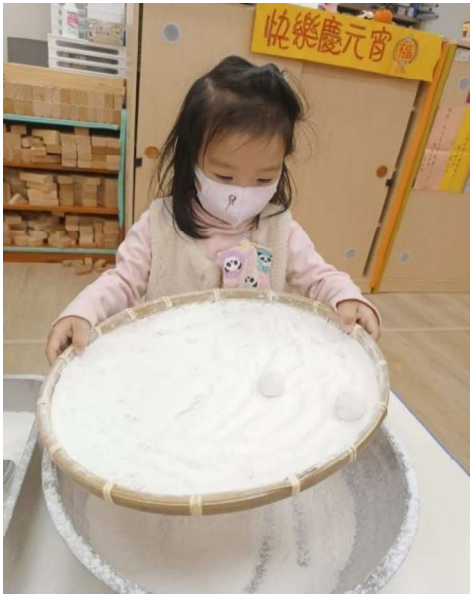
元宵節：初體驗滾元宵(幼幼班)