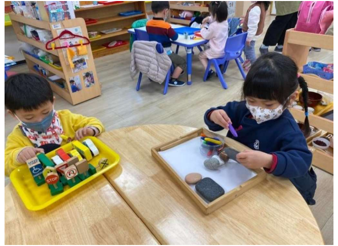
主題與學習區探索:數學、藝術