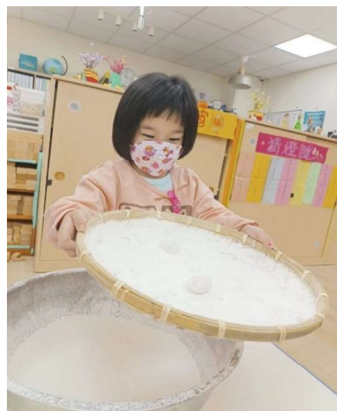
元宵節：多元學習~體驗滾元宵