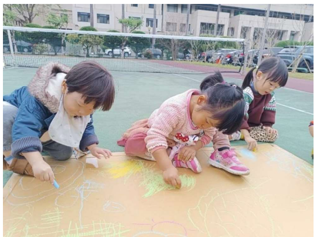
大地彩繪:合作學習~~創藝畫