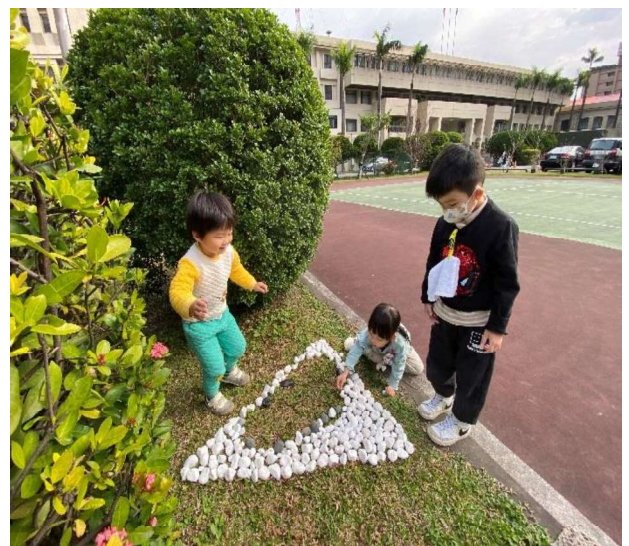
遊戲學習：快樂、合作與主動自主學習