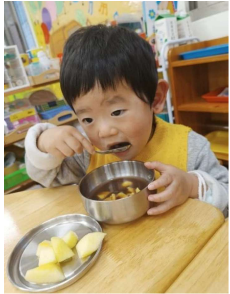
美食：營養點心~~紅豆湯元宵