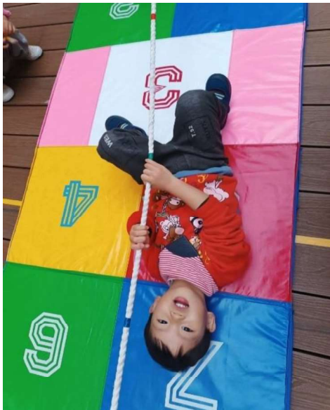
感統訓練：前庭發展