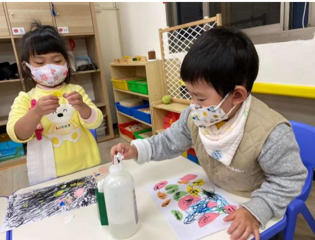
藝術創作:美感~~塗鴉撕貼創作畫