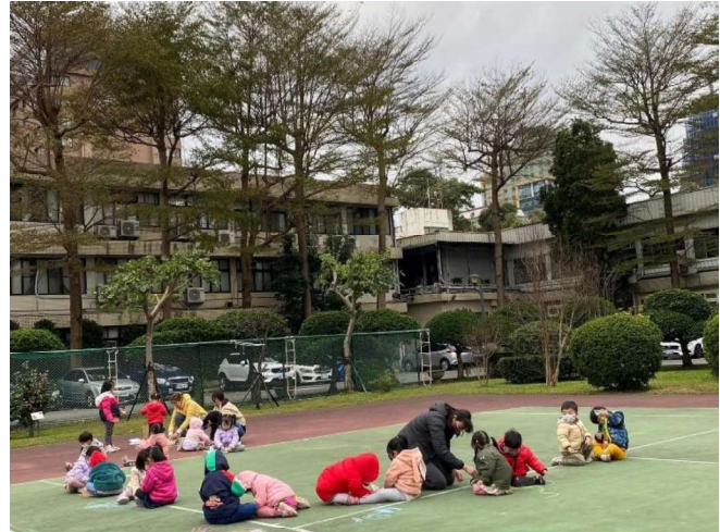
志工媽媽帶活動:鹽巴彩繪~~神秘的玩