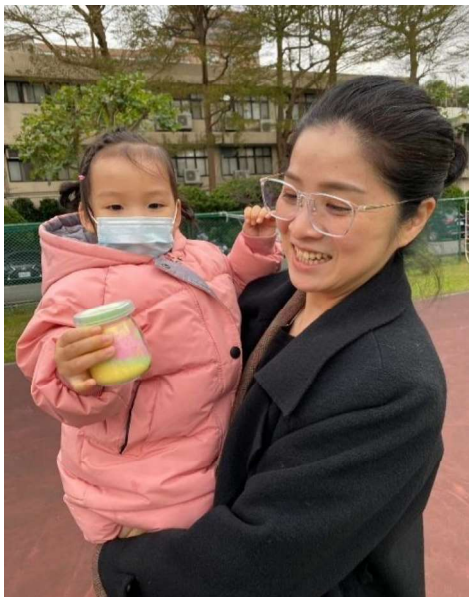
親子同樂與作品分享