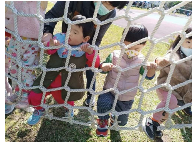
幼幼班:勇於探索~~學習攀岩