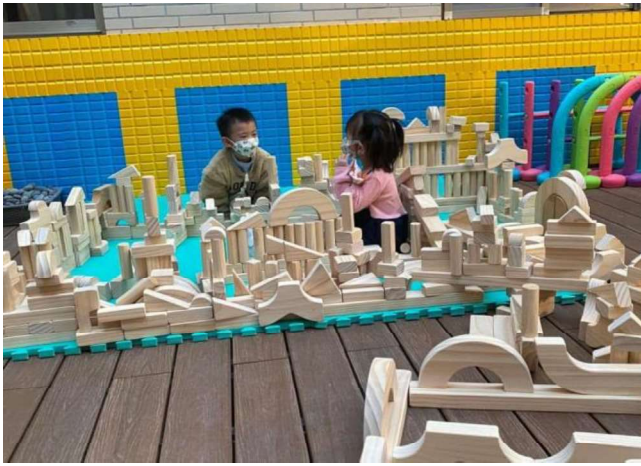
幾何積木建構:邏輯幾何概念~~拜登鐵塔