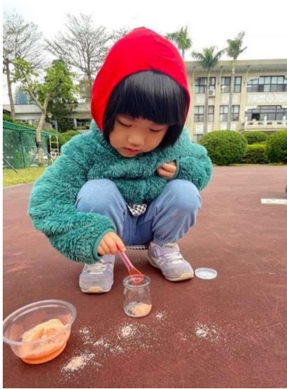
手作彩繪：瓶裝彩繪