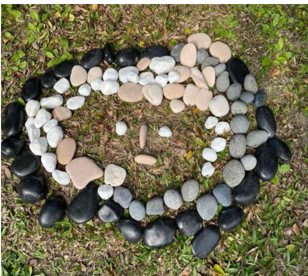
美感：訓練圖說能力~~藝術創作語言