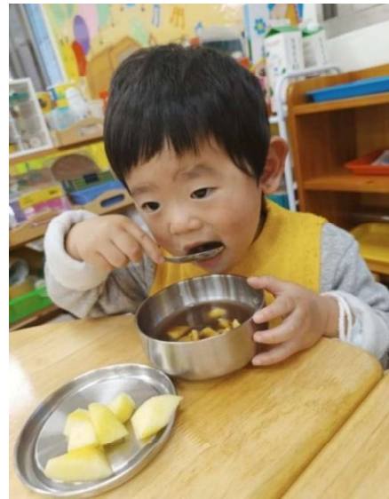
美食：營養點心~~紅豆湯元宵