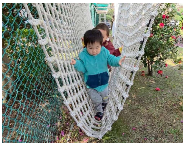
體能活動:感統訓練~~走繩網