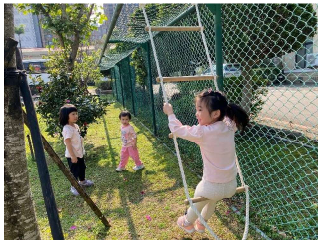
我們的遊戲:勇於探索~~盪鞦韆