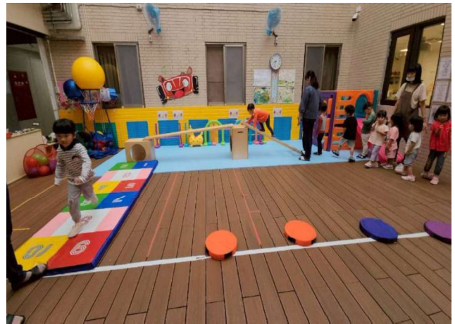
大肌肉活動：環視體能