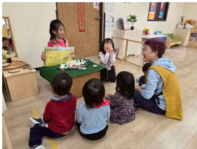
語文圖像表達:小劇場發表展演