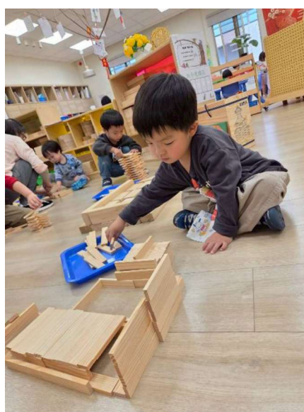
幾何積木建構:邏輯幾何概念