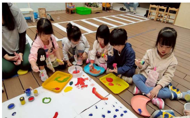
藝術彩繪:合作學習~創藝畫