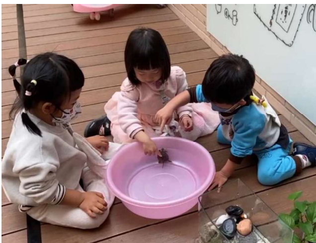
生命教育：愛護動植物與照顧~飼養烏龜