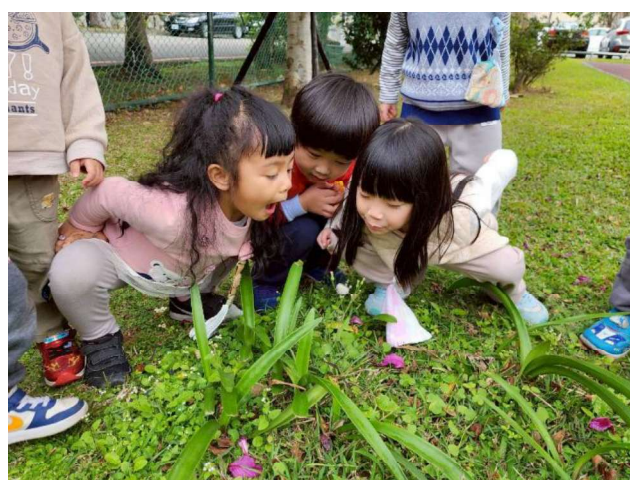
戶外自然觀察與探索