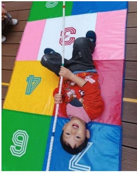
感統訓練：前庭發展