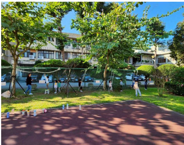
戶外各式攀繩探遊