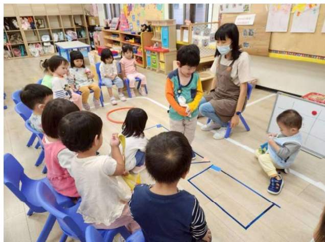
特色課程~創造思考玩遊戲