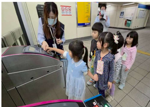
在地課程:實地踏訪捷運站