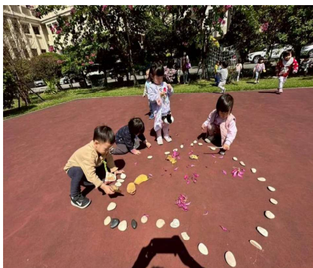
遊戲學習:快樂、合作與主動自主學習