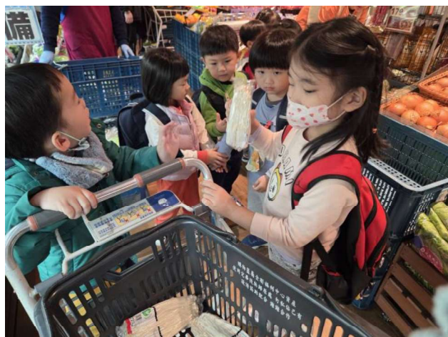
在地課程:小腳踏查超市採買趣