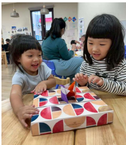
主題與學習區探索:數學、藝術