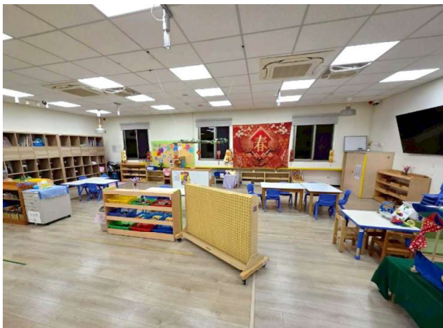
有機學習環境:學習區介紹~六大領域